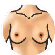
Un écoulement nouveau ou teinté de sang