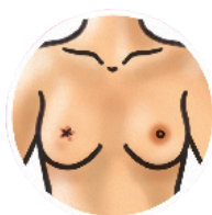
Changement au mamelon