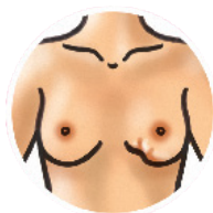
Plissement de la peau

Consultez votre prestataire de soins de santé si vous constatez un des changements ci-bas.